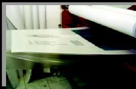
Laminação protege e aumenta a durabilidade dos trabalhos impressos com tinta à base de água

Outra característica importante é a isenção de manchas. De acordo com